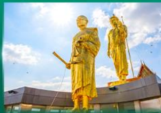
หลวงพ่อคูณ วัดบ้านไร่