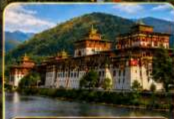
พูนาคาซอง (Punakha Dzong)