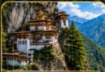
วัดทักซิง (Tiger's Nest)