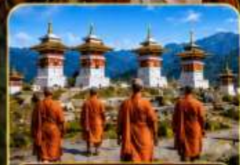
โดจุลาพาส (Dochula Pass)