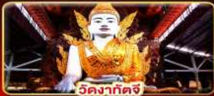
วัดงาทัดจี

สิทธิการะ 3 มหาบูชาสถาน พักบนอินทร์แวน 1 คืน