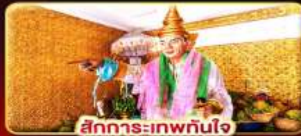
สิทธิการะเทพทันใจ