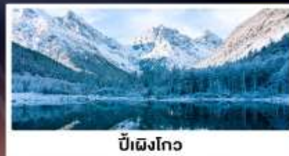
บี้ผิงโกว