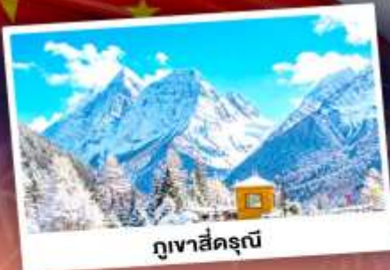
ภูเขาสีครุณี

เที่ยว 3 อุทยานแห่งชาติแห่งมณฑลเสฉวน ถ่ายรูปเช็คอินน้ำพุไม่ไผ่ยักษ์ เดินเล่นถนนโบราณ