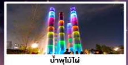
น้ำพุไม่ไผ่