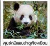
ศูนย์หมีแพนด้าดูเจียงเยี่ยน