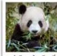
ศูนย์อนุรักษ์หมีแพนด้าฉู่เจียงเยียน