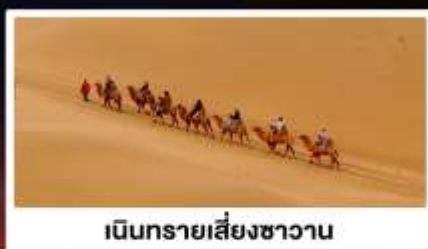
เป็นทรายเสี่ยงชาวน