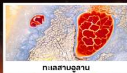
ทะเลสาบอูลาน