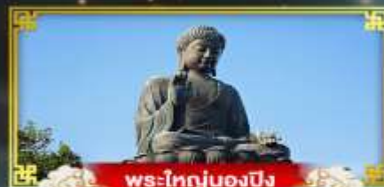
พระใหญ่ของปิง