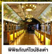
พิพิธภัณฑ์ไวน์ชิงเต่า