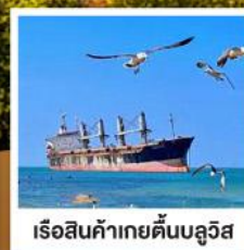
เรือสินค้าเกย์ตันบลูวิส