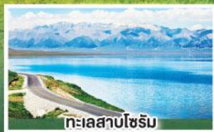
ทะเลสาบไซรัม