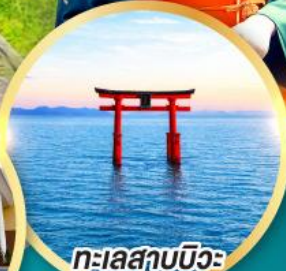
ทะเลสาบบิวะ เสาโทริอิ

เส้นทางสายอัลไพน์ทากายามา กำแพงหิมะ เพื่อนคู่ใจ