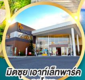
มิตรชวยเอาท์เล็ทพาร์ค คาโตะ