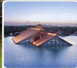
พิพิธภัณฑ์ไดน้ำกวางฟู่หลิน