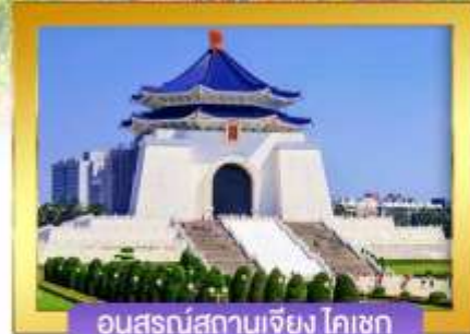
อนุสรณ์สถานเจียง ไคเชก