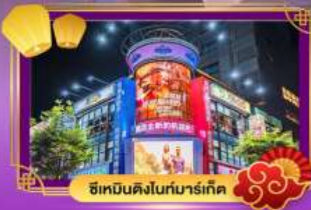
ซีเหมินดิงไนท์มาร์เก็ต