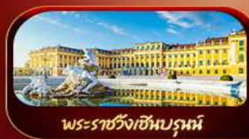
พระราชวังเซินบรูน์