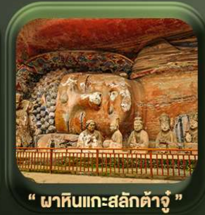
“ พาหินแคะสลักต้าจู้ ”