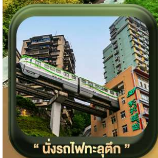
“ นั้รทไฟทะลุดัก ”

บินตรงลงจงซิ่ง • อุ้หลง หลุมฟ้าสะพานสวรรค์ • ระเบียงแก๊ว • อุทยานเขานางฟ้า หงหยาดัง • นั้รทไฟทะลุดัก • ศาลาประชาคม (ด้านนอก) • หลงหมินฮ่าว มรดกโลกพาหินแคะสลักต้าจู้ • วัดหลิวอัน • ตึกตะเกียบ • ถนนคนเดินเจียฟ้างเปย