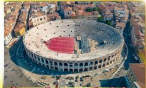
โรงละครโรมันกลางจัหวโรม่า