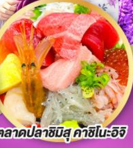
ตลาดปลาฮิมิสึ คาชิโมะจิ

ถ่ายรูปเชคอินวิวฟูจิ กับซุ้มประตูโทเซคิจิ แชนมออน อิสระท่องเที่ยว ช้อปปิ้งหนึ่งวันเต็มในโตเกียว