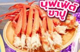
บุฟเฟ่ต์ ภูเขา