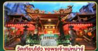
วัดเทียนโถ้ว ขอพรเจ้าแม่หน่าจู้