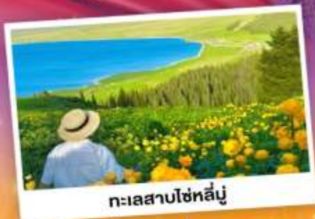
ทะเลสาบไซไห่ลู่

ถ่ายรูปทุ่งดอกลาเวนเดอร์ - กุ้งหนัวคาลาจัน SKY GRASSLAND กุ้งหนัวมรดกโลก