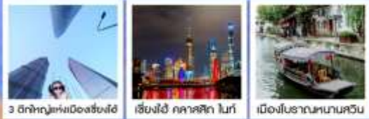
3 ตึกใหญ่แห่งเมืองเซี่ยงไฮ้ | เซี่ยงไฮ้-อาคารสีฟ้า ไนท์ | เมืองโบราณหนานชวิน