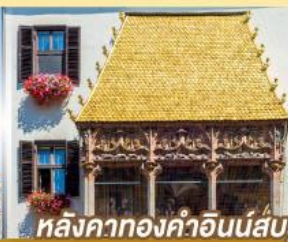
หลังคาทองคำอินน์ส์บรุค