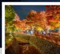
อุโมงค์เมบิล