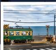
รถไฟโอบะเด็น