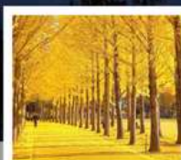
สวนเอ๊กชิโป