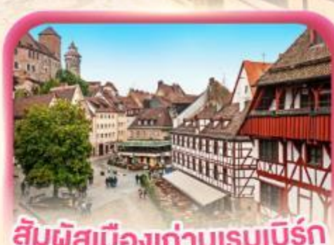
สัมผัสเมืองเก่าบูเรมเบิร์ก