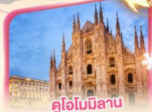
คูโอโมมิลาน