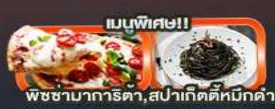
เมนูพิเศษ!! พืชซากการิตา, สปาเก็ตตี้หมักดำ