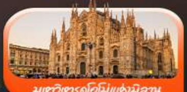
มหาวิหารดูโอโมแห่งมิลาน