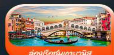
คลองเรือชมเกาะเวนิส