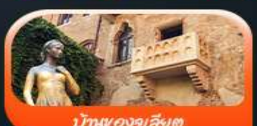
บ้านของจูเลียต

พิเศษ ขึ้นกระเช้าชมวิวเขาโดโลไมท์ ALPE DI Siusi