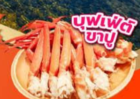
บุฟเฟ่ต์ซูชิ