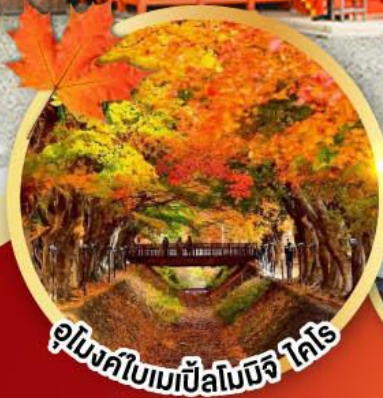
อุโมงค์ใบเมเปิ้ลโมจิ ไทโร