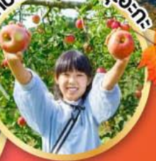
เก็บผลไม้เมืองชิซุโอะกะ