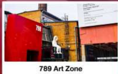
798 Art Zone