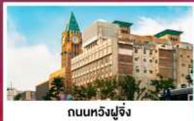
ถนนหวังฝูจิ่ง