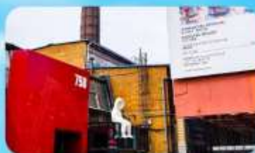
798 Art Zone