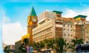
ถนนหวังฝูจิ่ง