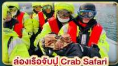
ล่องเรือจับปู Crab Safari

เยือนเมืองหลวงแห่งแสงเหนือ สัมผัสความสวยงามของนอร์เวย์ที่แท้จริง