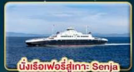
นั่งเรือเฟอร์รี่สู่เกาะ Senja