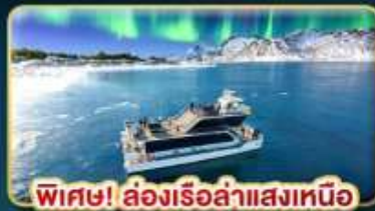
พิเศษ! ล่องเรือล่าแสงเหนือ