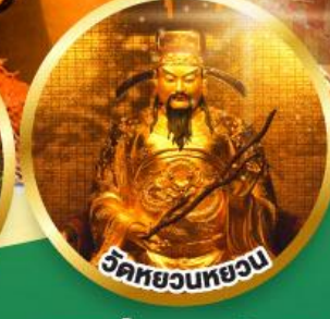
วัดหยวนหยวน

ขอพรเรื่องสุขภาพ, โชคลาภ ความเจริญก้าวหน้า