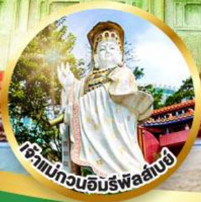
เจ้าแม่กวนอิมรัฟลัดโบย