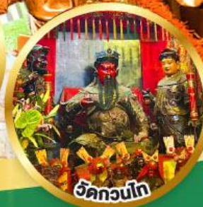
วัดกวนโก