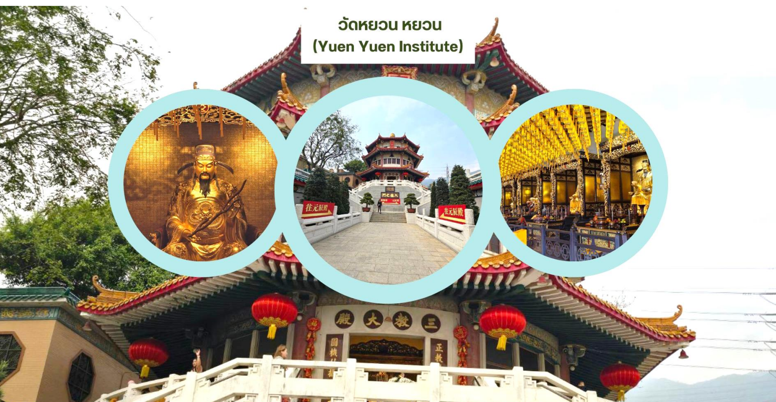
วัดหยวน หยวน (Yuen Yuen Institute)