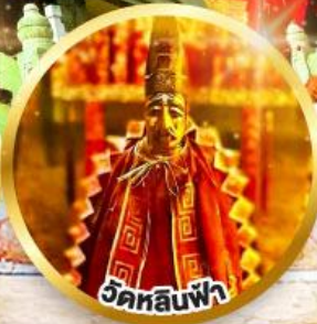
วัดลีนฟ้า

ขอพรเรื่องการศึกษา, การงาน สติปัญญาและความกล้าหาญ