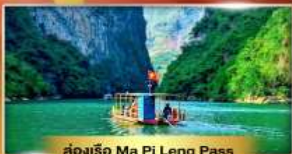
ส่องเรือ Ma Pi Leng Pass

เส้นทางเปิดใหม่ ซาฮาง เช็คอินเมืองตามด้าว "เวียดนามฟีลยุโรป"