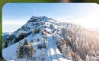
พิชิต 3 ยอดเขาคิง Rigi / Schilthorn / Gornergrat