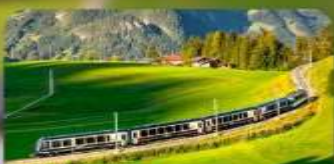
นั้งรถไฟสายโรแมนติก 3 สาย Golden Pass / Luzern Interlaken Express / Gornergrat